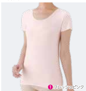
1 フレッシュピンク