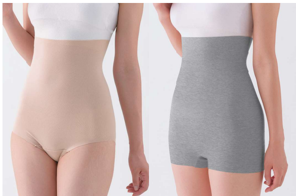
レギュラータイプ(シュガーブラウン)