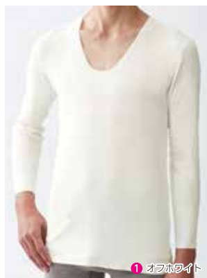
4 Uネック8分袖シャツ NP0008