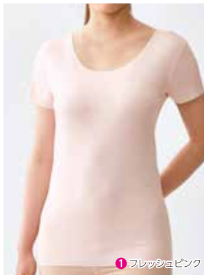
1 2分袖インナー NP0052