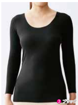
2 8分袖インナー NP0046