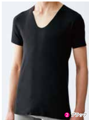
3 UネックTシャツ NP0016