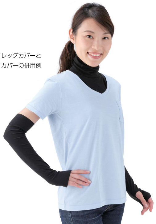
アーム・レッグカバーと ネックカバーの併用例