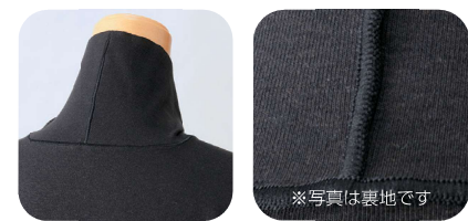
縫い目は首回りと首の後ろ側のみ