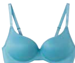
モールドカップブラジャー (ノンワイヤー)