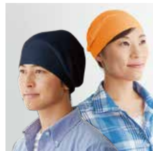
サポートキャップ