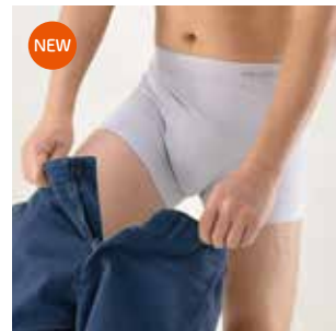
ボクサーブリーフ