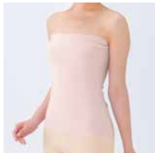
カッティングチューブ