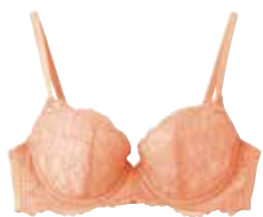
ワイヤー入りブラジャー