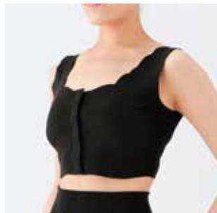
前開きハーフトップ