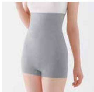
ハイウエストショーツ