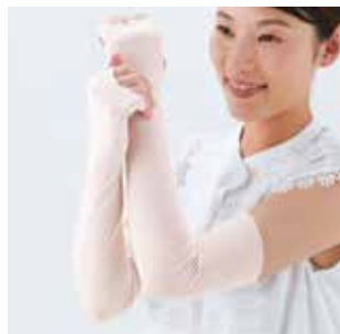
アーム・レッグカバー